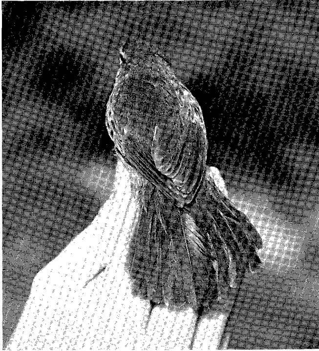
Fig. 2. Cetti's Zanger. Fig. 2. Cetti's warbler.